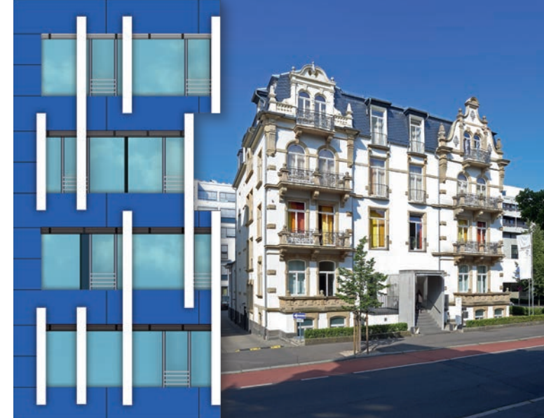
GÄSTEHAUS DER KERCKHOFF-KLINIK